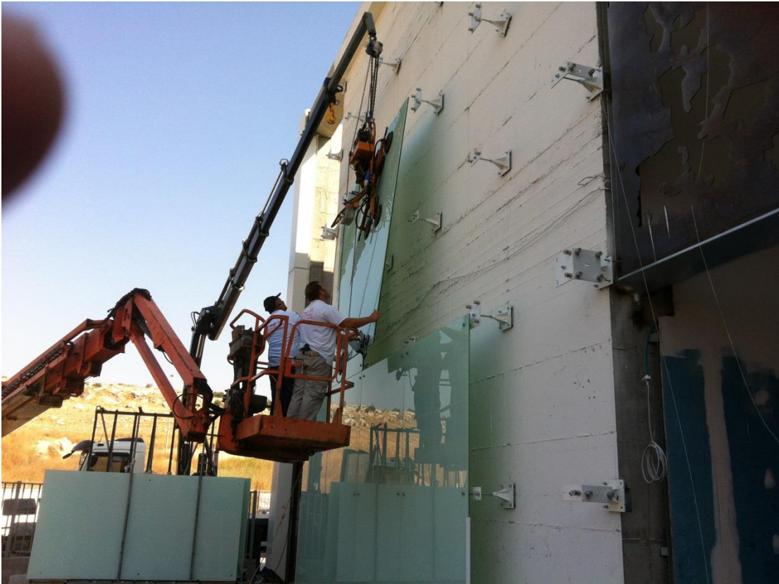
קיר ספיידרים עם תאורת LED אחורית בהקמה