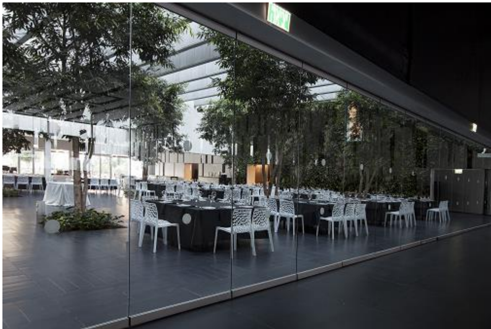
מערכת דלתות נאספות במצב סגור