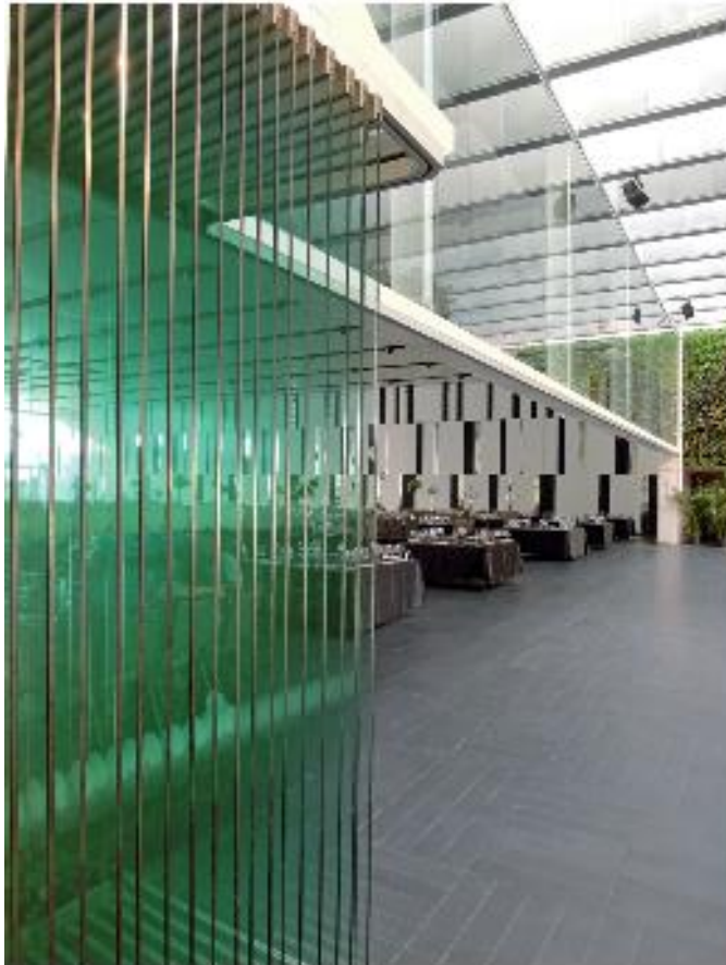
מערכת של 21 דלתות נאספות DORMA במצב פתוח (מקופל)