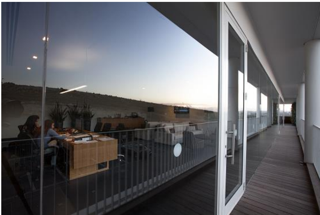
חזית יציאה למרפסת, דלתות 4900 עם מחזיר שמן עליון TS 92 ומעצור דלת HOLDER