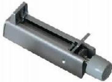
DORMA DOOR HOLDER 360