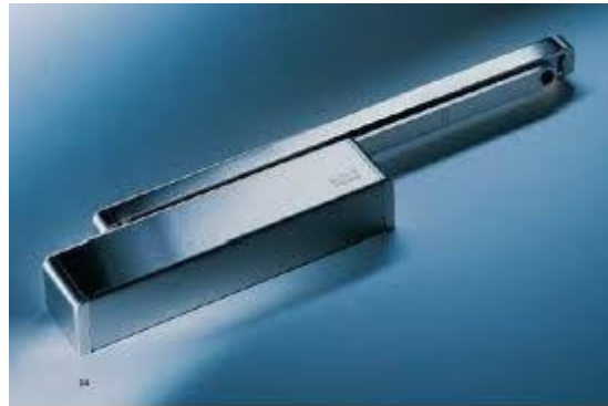
DORMA TS 92