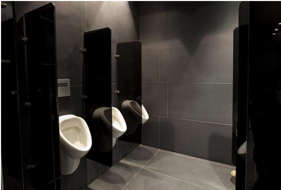
מחיצות משתנות מזכוכית עם הדפסה קראמית שחורה