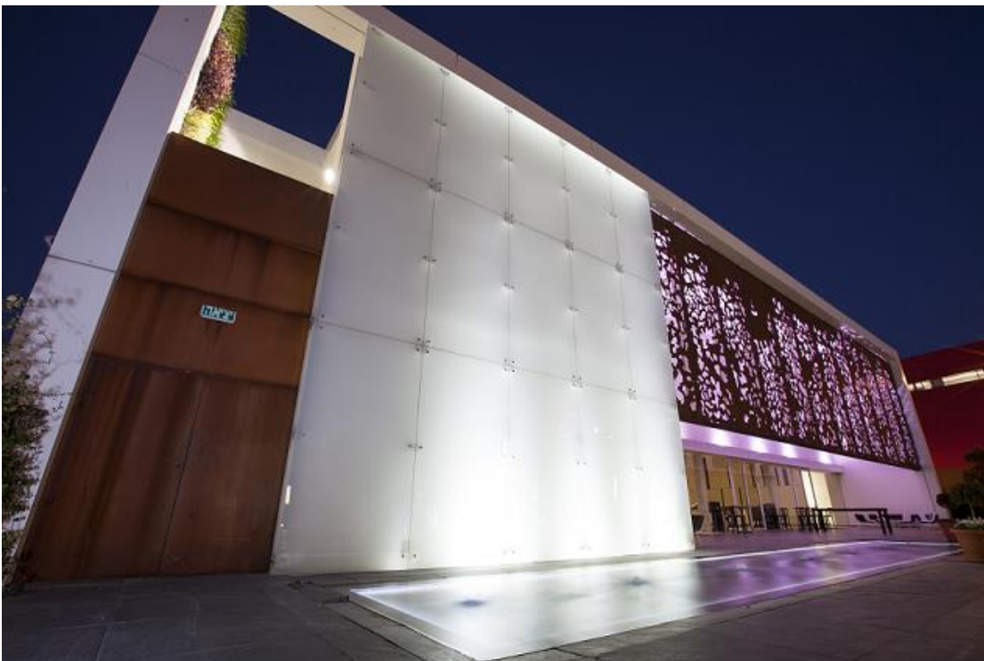
קיר ספיידרים עם תאורת LED אחורית בלילה