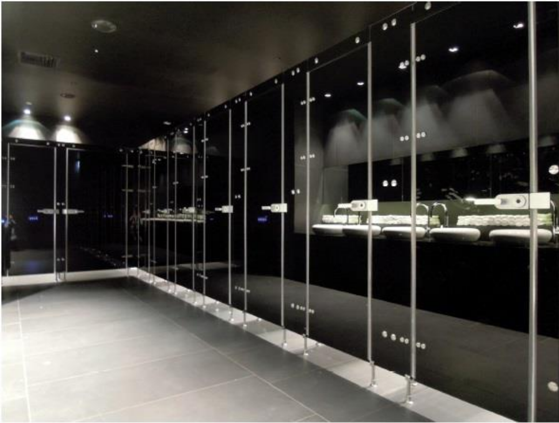
תאי שירותים עם מנעול DORMA STUDIO RONDO (תפוס/פנוי)