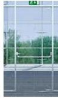
DORMA PHA 2000